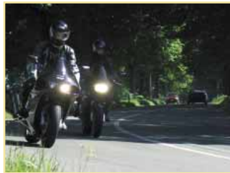
„Biker“ auf der Tour

Heilklimatischer Kurort mit historischem Ortskern, Nieheimer Schaukäserei, Westfalen Culinarium (ab Ostern 2006)