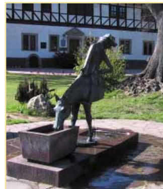
Lügenbaron von Münchhausen

Heimatstadt des Lügenbarons von Münchhausen. Schmucke Altstadt mit Münchhausen-Museum